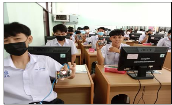
เรียนรู้การเขียนโปรแกรมผ่านโปรแกรมจำลอง KidBright simulator และ Makecode