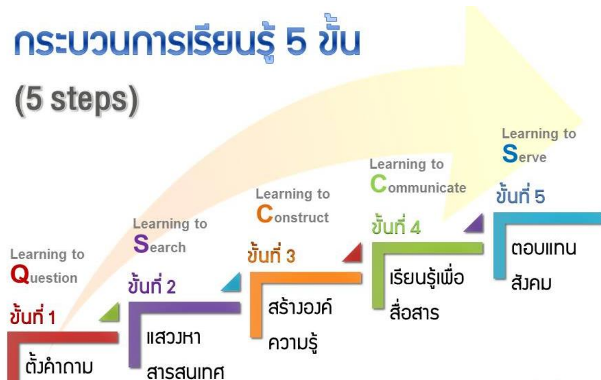
ภาพที่ 2 กระบวนการเรียนรู้ 5 ขั้น (5 steps)

การสอนบูรณาการตามแนวทางการจัดการเรียนรู้ในศตวรรษที่ 21 สู่การสร้าง Soft Power : P.T.K. ALL COFFEE ผ่านแหล่งเรียนรู้ในท้องถิ่นผ่านกิจกรรมชุมนุมสุขภาพและความงาม ได้ดำเนินการจัดการเรียนรู้ให้กับผู้เรียนด้วยกระบวนการ 5 Steps ซึ่งเป็นแนวการจัดการเรียนการสอนโดยใช้วิธีการสืบสอบหรือวิธีสอนแบบโครงงาน ประกอบด้วย "การตั้งคำถาม การแสวงหาสารสนเทศ การสร้างความรู้ การสื่อสาร และการตอบแทนสังคม" ดังนี้