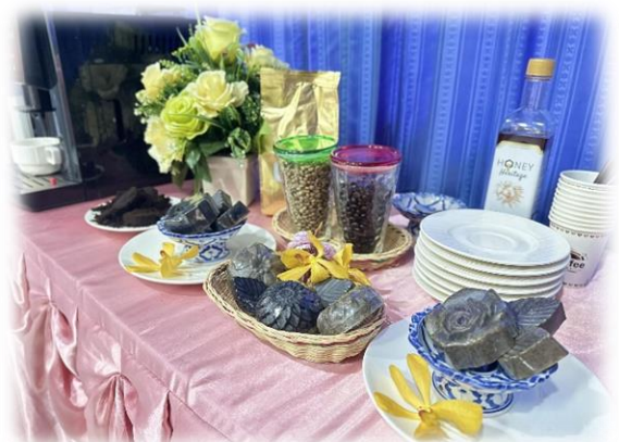
การทำผลิตภัณฑ์สปูจากกากกาแฟ