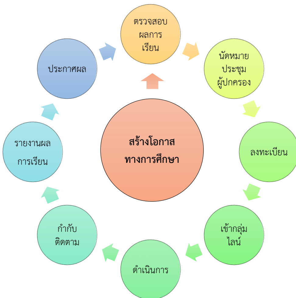
รูปแบบ 3S Model ประกอบด้วยรายละเอียดการดำเนินงาน ดังนี้