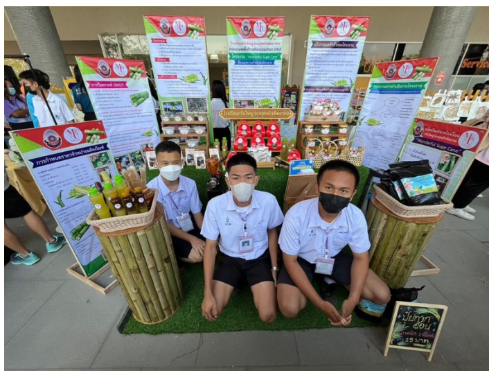
เข้าร่วมการแข่งขันศิลปหัตถกรรมนักเรียน