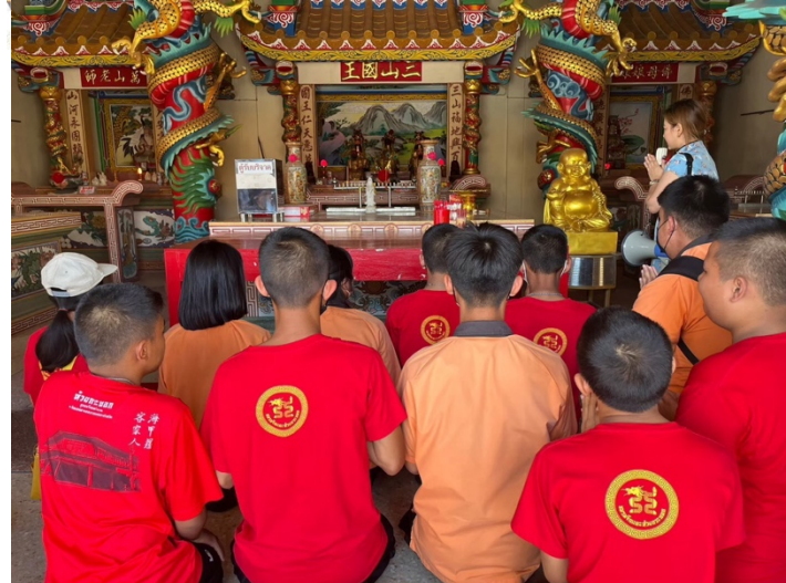
ศึกษาดูงาน