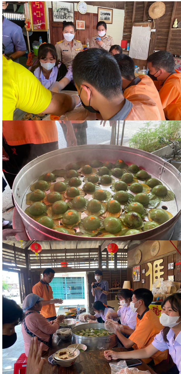
เข้าร่วมการ ศิลปะหัตถกรรม