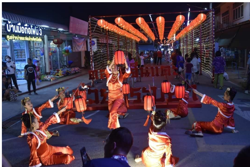
นำนักเรียนเข้าร่วมกิจกรรมชุมชน