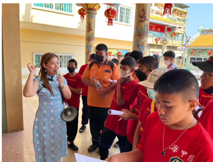
ศึกษาเรียนรู้อาหารท้องถิ่น