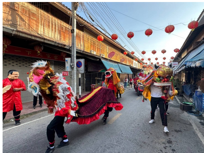
นักเรียนเข้าร่วมกิจกรรมวันตรุษจีนชุมชนจีนแคะ ห้วยกระบอก