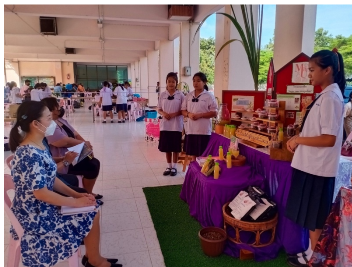
นำนักเรียนเข้าร่วมกิจกรรมชุมชน