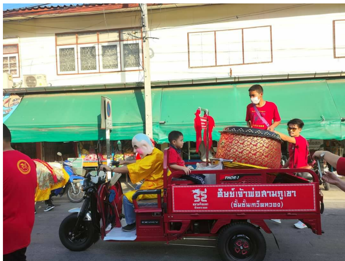
เข้าร่วมกิจกรรมรายการ ฟันใจเมือง ณ เยาวราช กรุงเทพมหานคร