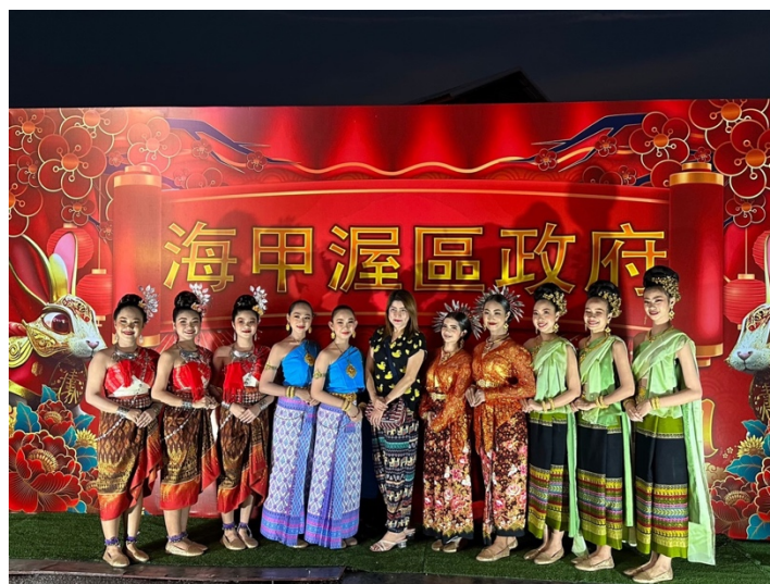
นักเรียนเข้าร่วมกิจกรรมวันตรุษจีนชุมชนจีนและ คุ้มกระบอง