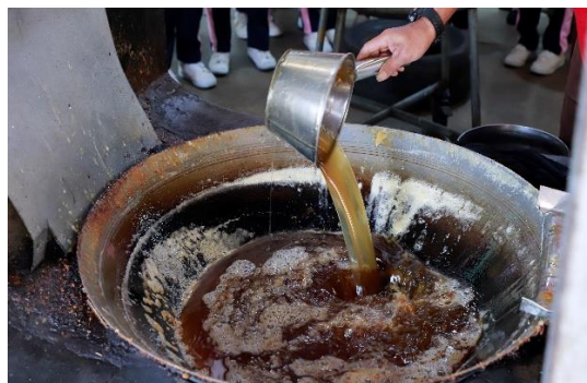
ฐานการเรียนรู้ที่ 3 ฐานกิจกรรมหยอดน้ำตาลปึก