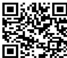
แบบคัดกรองคณิต ม.2