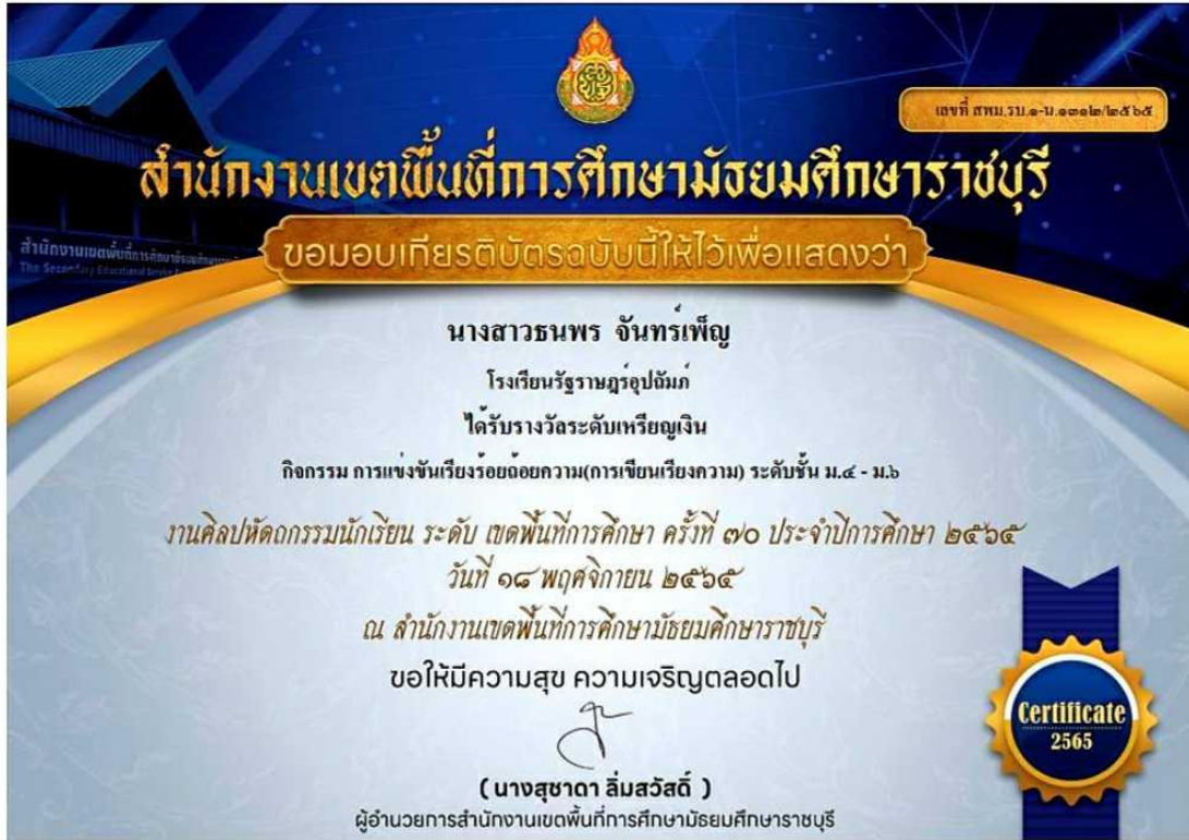
ภาพที่ 7 : เกียรติบัตรรางวัลระดับเหรียญเงินการแข่งขันเขียนเรียงร้อยถ้อยความ