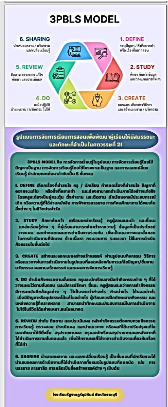
ภาพที่ 27 : 3PBL MODEL