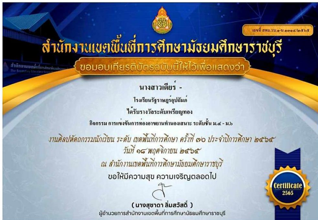
ภาพที่ 6 : เกียรติบัตรรางวัลระดับเหรียญทองการแข่งขันท่องอาขยานทำนองเสนาะ