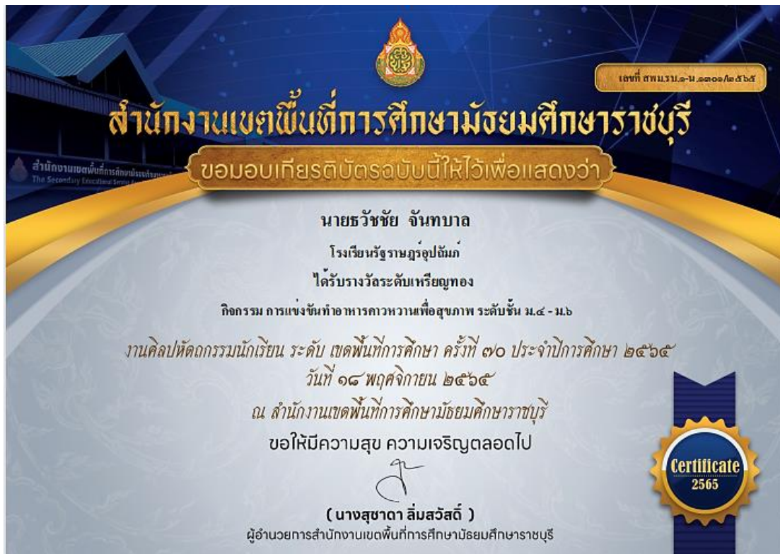
ภาพที่ 21 : รางวัลระดับเหรียญทอง การแข่งขันทำอาหารคาวหวานเพื่อสุขภาพ