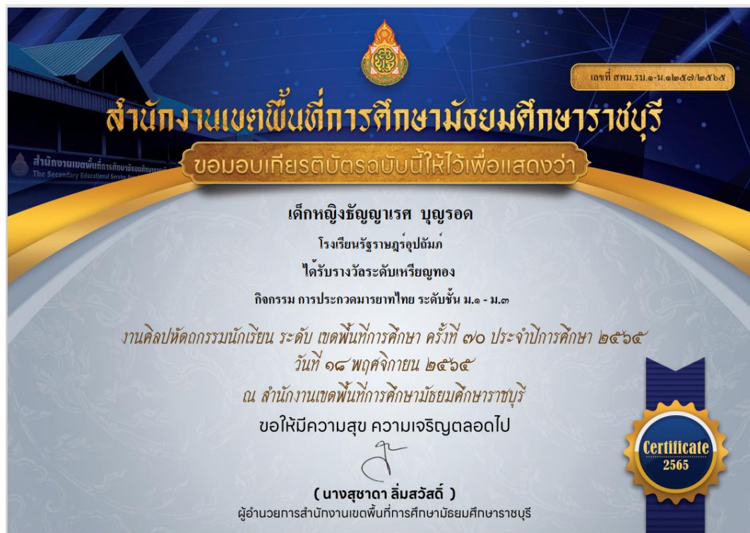
ภาพที่ 24 : รางวัลระดับเหรียญทอง ในการแข่งขัน มารยาทไทย ระดับมัธยมศึกษาตอนต้น