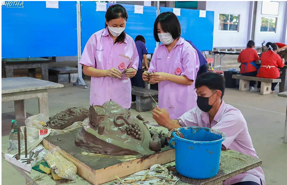
ภาพที่ 13 : รางวัลระดับเหรียญทองแดง ระดับชาติ การแข่งขันปติมากรรม ระดับชั้นมัธยมศึกษาตอนปลาย