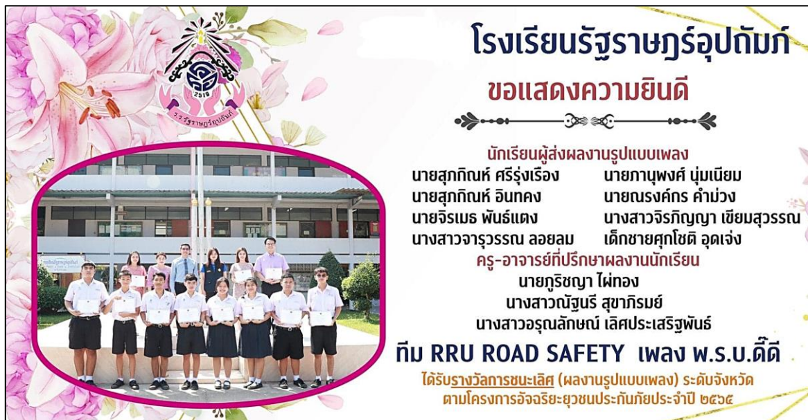
ภาพที่ 14 : รางวัลยุวชนประกันภัยดีเด่น ประเภทเพลง ชนะเลิศระดับจังหวัด