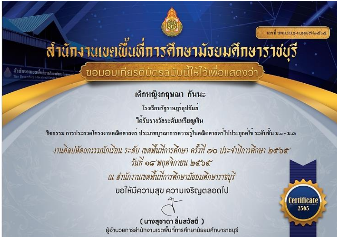
ภาพที่ 9 : เกียรติบัตรรางวัลระดับเหรียญเงิน การประกวดโครงงานคณิตศาสตร์