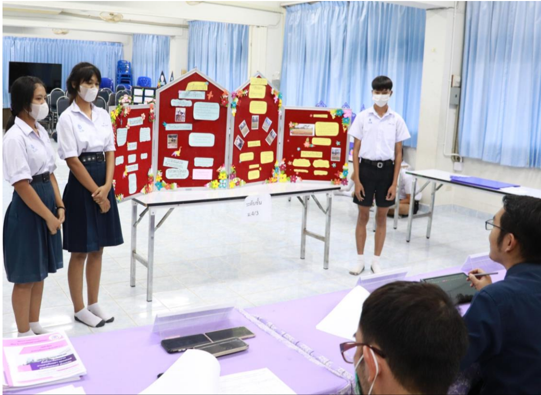
ภาพที่ 3 : การจัดกิจกรรมการเรียนรู้โดยใช้โครงงานเป็นฐาน