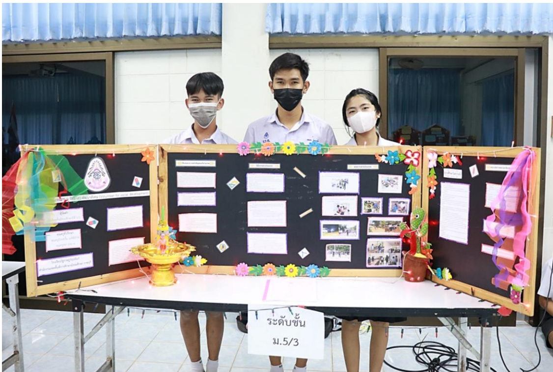
ภาพที่ 12 : นักเรียนได้รับรางวัลชนะเลิศ โครงการคุณธรรมระดับห้องเรียน