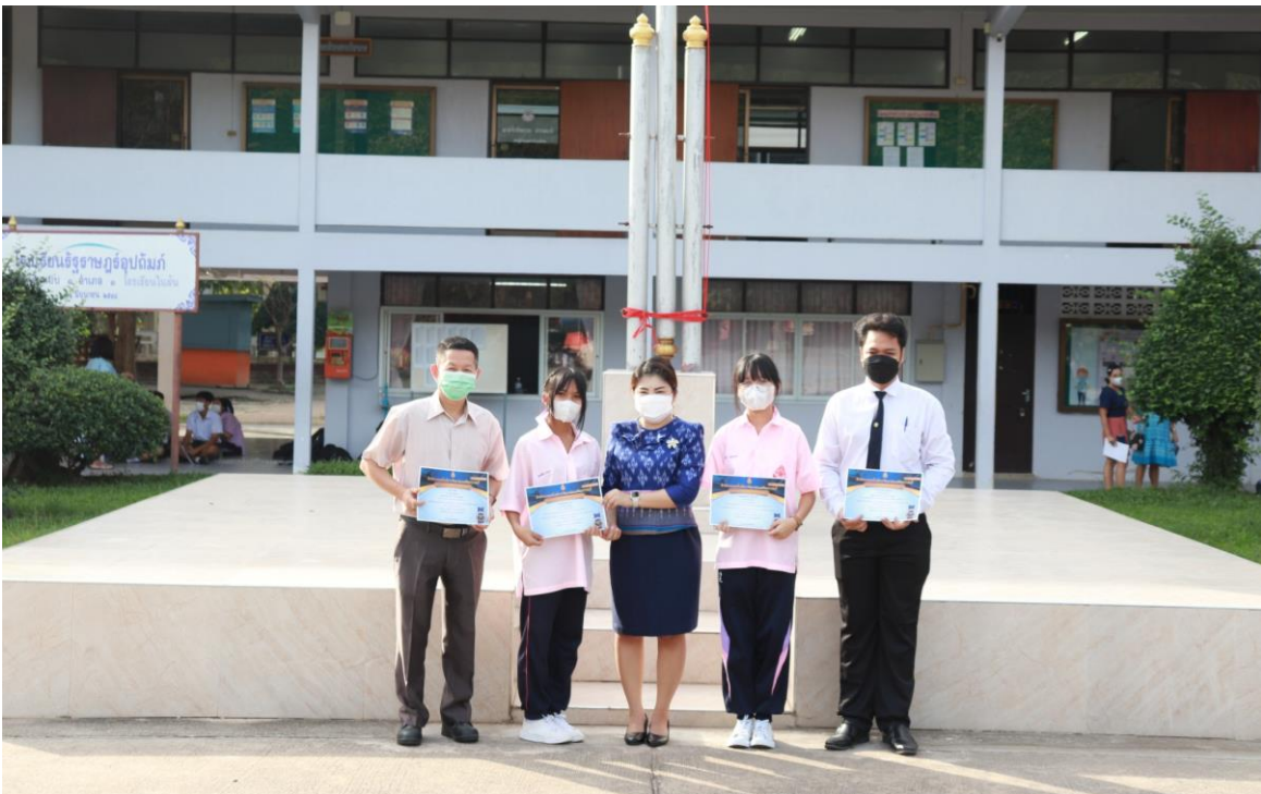
ภาพที่ 20 : รางวัลระดับเงิน ในการแข่งขันการออกแบบสิ่งของเครื่องใช้ด้วยโปรแกรมคอมพิวเตอร์