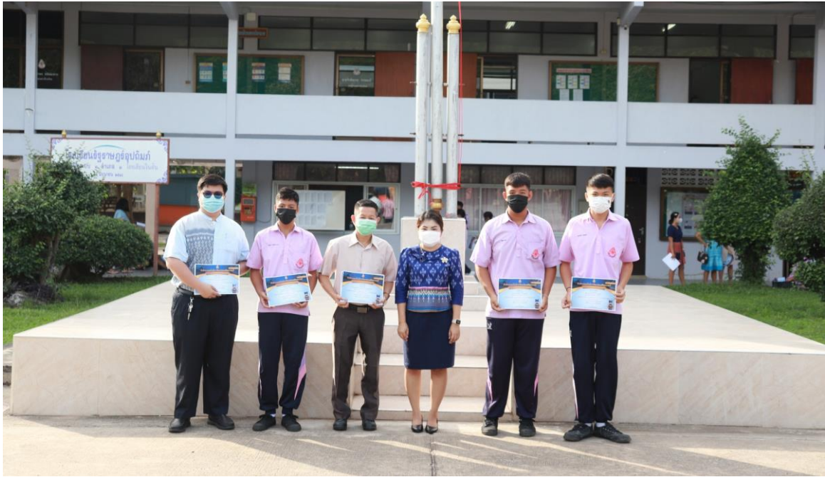
ภาพที่ 19 : รางวัลระดับเหรียญทอง รองชนะเลิศอันดับที่ 1 การแข่งขันหุ่นยนต์ระดับกลาง