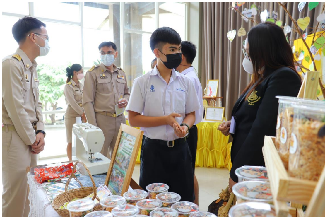
ภาพที่ 4 : การนำเสนอผลงานและแลกเปลี่ยนเรียนรู้