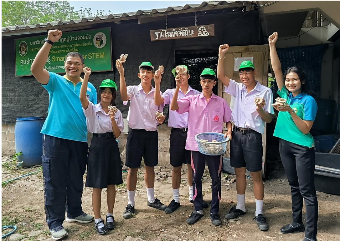
ภาพที่ 17 : รางวัลบุคลากรทางการเกษตรดีเด่น ระดับจังหวัด ประจำปี 2566 สาขาสมาชิกกลุ่มยุวเกษตรกร