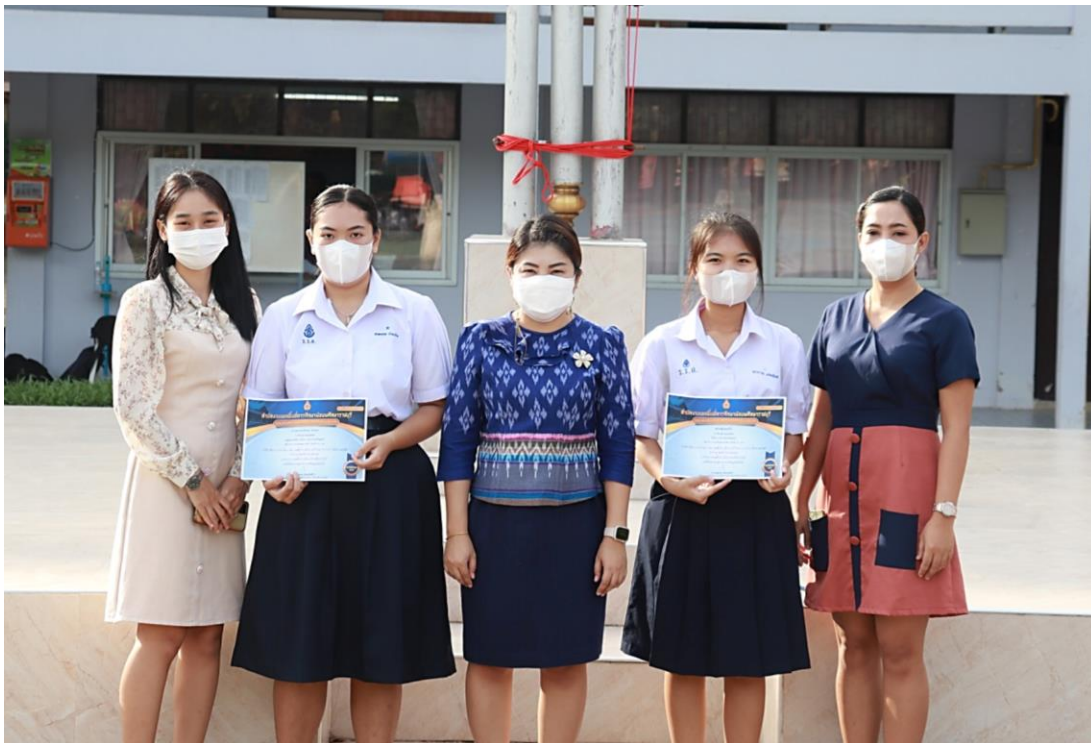
ภาพที่ 8 : นักเรียนได้รับเกียรติบัตรตัดลายมือภาษาจีน