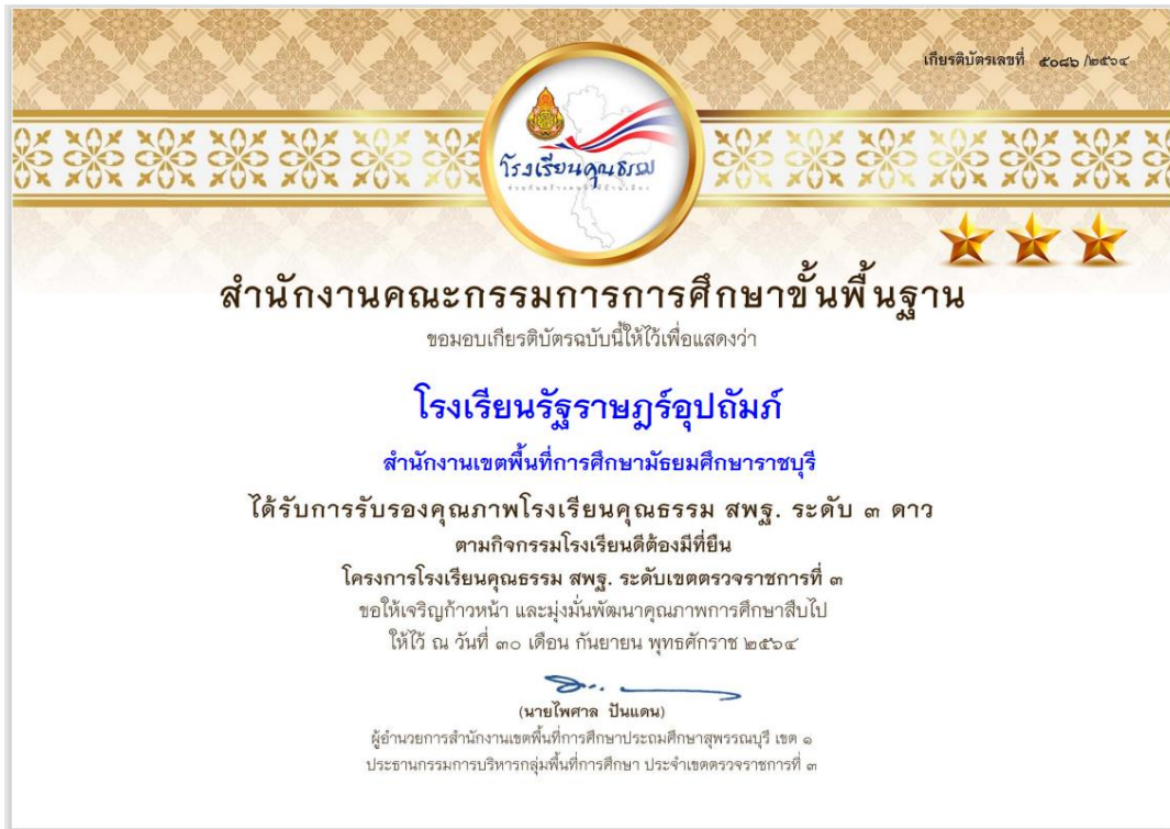
ภาพที่ 23 : โรงเรียนคุณธรรม สพฐ. ระดับ 3 ดาว