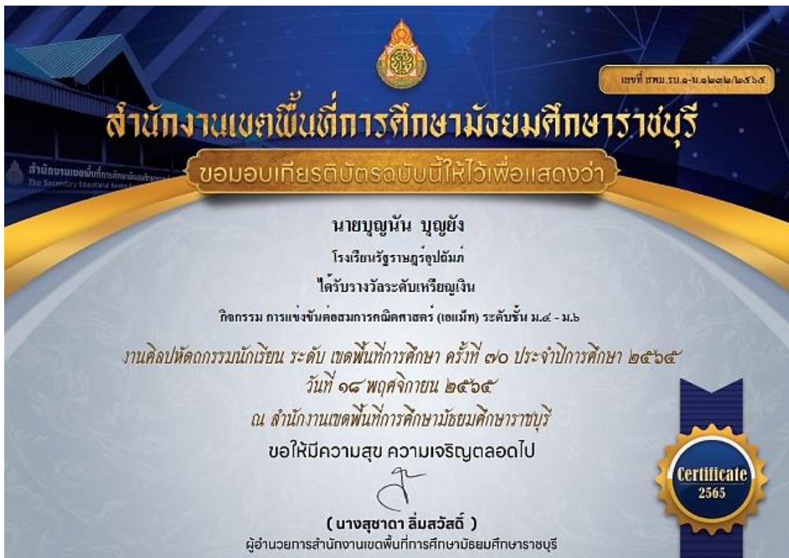
ภาพที่ 10 : เกียรติบัตรรางวัลระดับเหรียญเงิน การแข่งขันต่อสมการคณิตศาสตร์