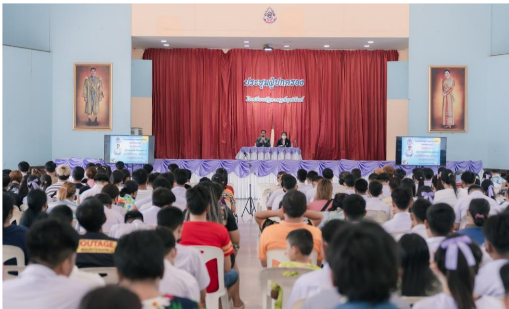
ภาพที่ 26 : การประชุมผู้ปกครอง ตระหนักถึงความสำคัญต่อการมีส่วนร่วมในการจัดการศึกษาของโรงเรียน