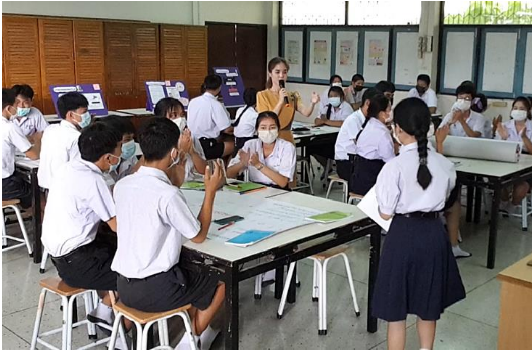
ภาพที่ 1 : การจัดกิจกรรมการเรียนรู้แบบ ในรูปแบบ