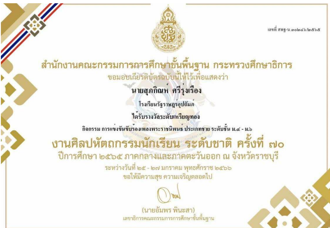
ภาพที่ 22 : รางวัลระดับเหรียญทอง การแข่งขันร้องเพลงพระราชนิพนธ์ ประเภทชาย ระดับมัธยมศึกษาตอนปลาย