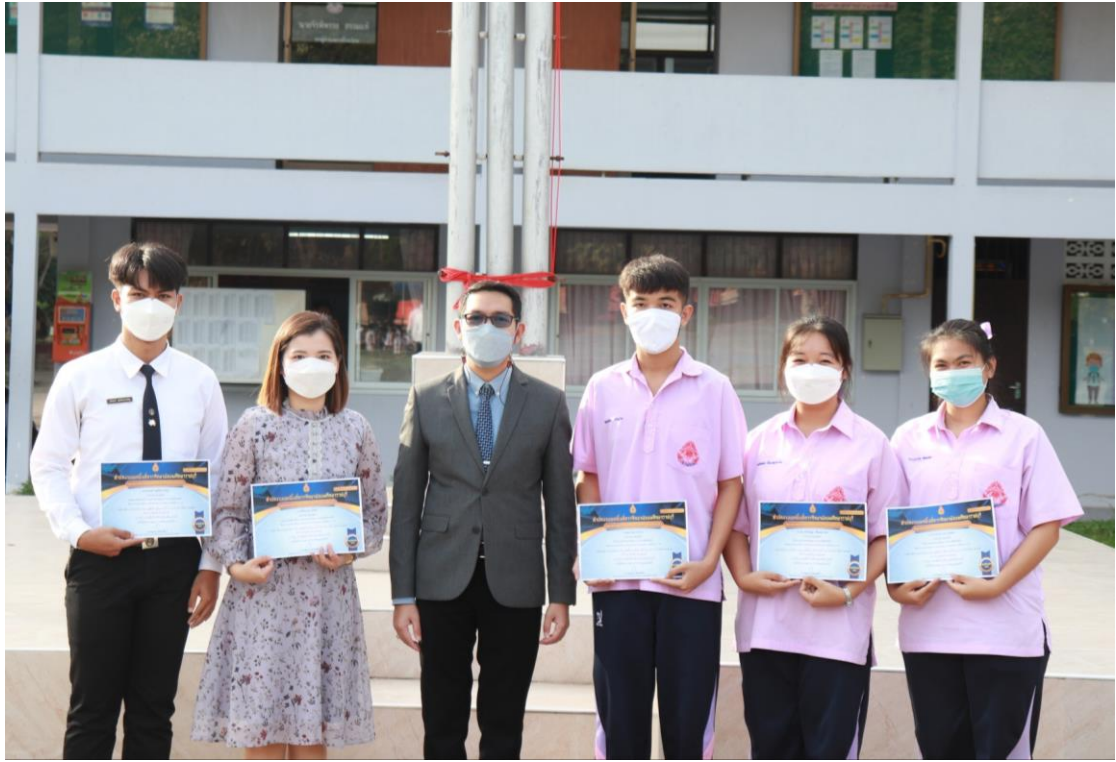
ภาพที่ 11 : นักเรียนได้รับเกียรติบัตรรางวัลระดับเหรียญทอง โครงการวิทยาศาสตร์ประเภททดลอง