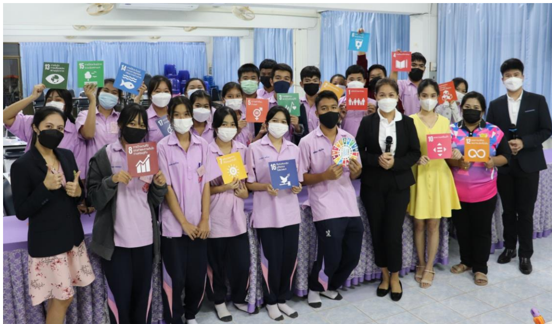
ภาพที่ 18 : นักเรียนได้รับพัฒนาภาวะความเป็นผู้นำ ภายใต้การประชุมเชิงปฏิบัติการ หัวข้อการส่งเสริมพฤติกรรม เชิงบวกและภาวะผู้นำสู่เป้าหมายการพัฒนาที่ยั่งยืน SDGs