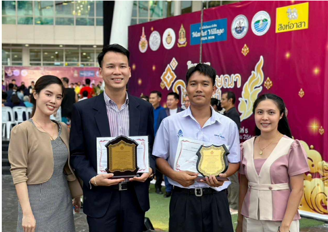
ภาพที่ 15 : รางวัลบุคคลต้นแบบความดี ประเภทครูและนักเรียน โครงการอัตลักษณ์ภาษาศิลป์ กับศิลปะศิลป์บนถิ่นไทย ปี 2566