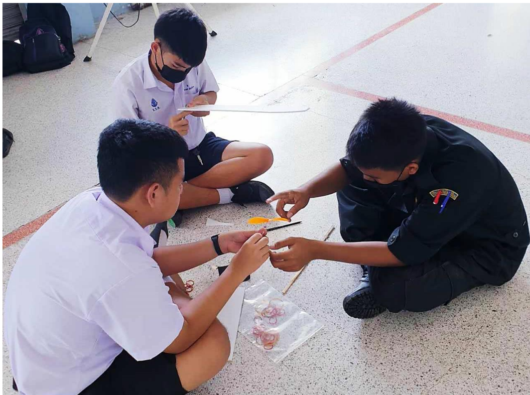
ภาพที่ 2 : การจัดกิจกรรมการเรียนรู้โดยใช้ปัญหาเป็นฐาน