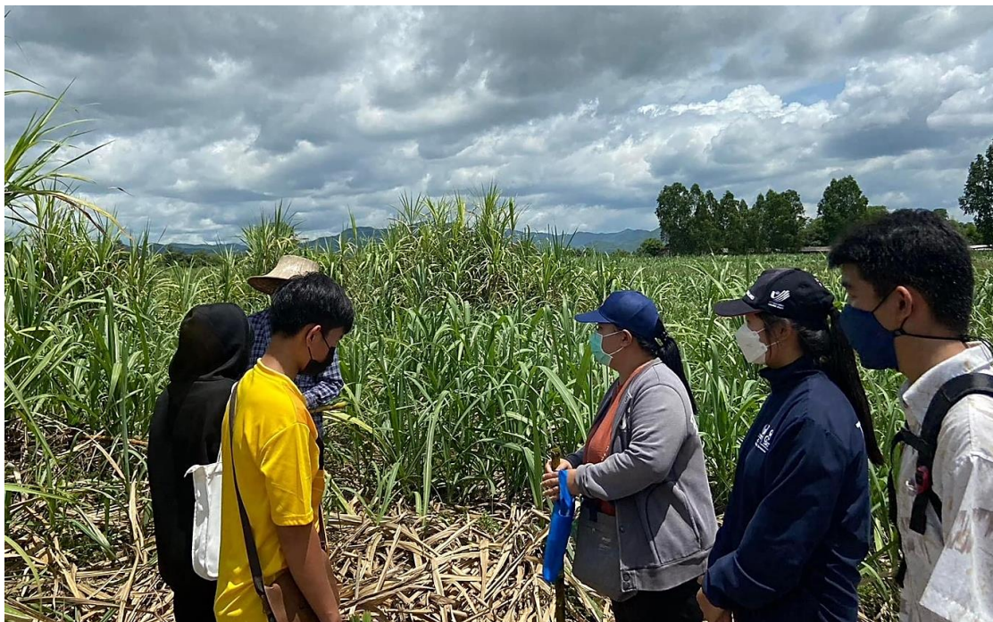
ภาพที่ 16 : การเผยแพร่โครงการสิ่งแวดล้อมร่วมกับชุมชน เรื่อง ความหวานของอ้อยและปัจจัยทางเคมี และกายภาพ ภายใต้โครงการ Globe Thailand ของ สสวท