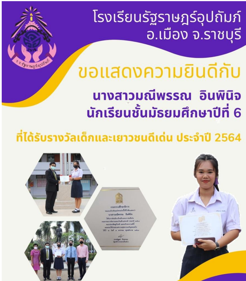
ภาพที่ 25 : นักเรียนได้รับรางวัลเด็กและเยาวชนดีเด่นแห่งชาติ ปี 2564