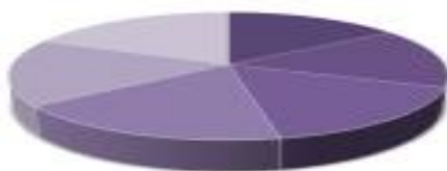
ความสามารถการเขียน