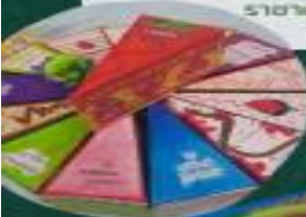
ความสามารถในการอ่าน

กิจกรรมสร้าง เป็นกิจกรรมที่ส่งเสริมความสามารถการอ่าน การเขียน เป็นกิจกรรมที่ให้นักเรียนนำเรื่องราวในชีวิตจริงของตนเองมาสร้างหนังสือเล่มเล็ก