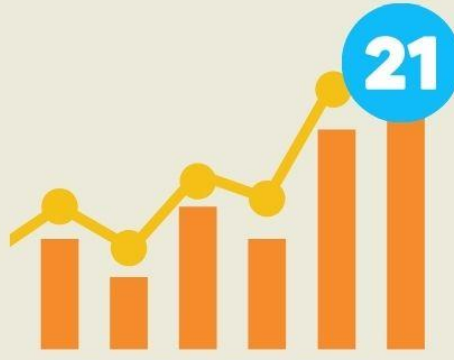
คุณภาพผู้เรียน / ทักษะในศตวรรษที่ 21