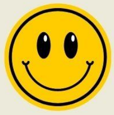
บรรยากาศการเรียนรู้ที่ดี มีความสุข สนุกกับการเรียนรู้