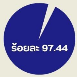
ครูจัดการเรียนรู้ตามแนวทาง Active Learning ได้อย่างมีประสิทธิภาพ นำไปสู่การเลื่อนวิทยฐานะให้สูงขึ้น