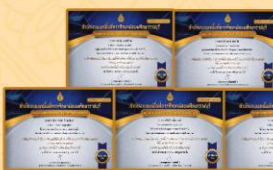
- ได้รับรางวัลระดับเหรียญทอง รองชนะเลิศอันดับที่ 1 การแข่งขันทำอาหารดาวหวานผลสุก งานศิลปหัตถกรรมนักเรียน ระดับเขตพื้นที่การศึกษา ครั้งที่ 70 ประจำปีการศึกษา 2565