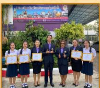
- ได้รับรางวัลระดับเหรียญทอง ระดับชาติ การแข่งขัน หนังสือเล่มเล็ก ระดับชั้น ม.4 - ม.6 งานศิลปหัตถกรรมนักเรียน ระดับชาติ ครั้งที่ 70 ประจำปีการศึกษา 2565