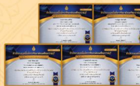
- ได้รับรางวัลระดับเหรียญทอง รองชนะเลิศอันดับที่ 1 การประกวดโครงงานอาชีพ ระดับชั้น ม.4 - ม.6 งานศิลปหัตถกรรมนักเรียน ระดับเขตพื้นที่การศึกษา ครั้งที่ 70 ประจำปีการศึกษา 2565