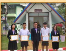
- ได้รับรางวัลระดับเหรียญทอง ระดับชาติ การประกวดผลงานสิ่งประดิษฐ์ทางวิทยาศาสตร์ ระดับชั้น ม.4 - ม.6 งานศิลปหัตถกรรมนักเรียน ระดับชาติ ครั้งที่ 70 ประจำปีการศึกษา 2565