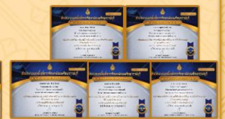
- ได้รับรางวัลระดับเหรียญทอง รองชนะเลิศอันดับที่ 1 กิจกรรม การประกวดโครงงานคุณธรรม ระดับชั้น ม.4 - ม.6 งานศิลปหัตถกรรมนักเรียน ระดับเขตพื้นที่การศึกษา ครั้งที่ 70 ประจำปีการศึกษา 2565